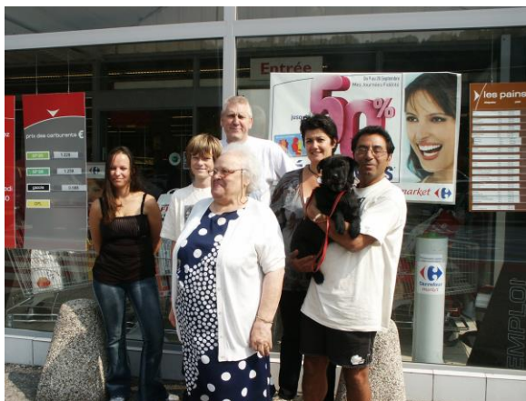
Quelques bénévoles lors de la récolte de nourriture de septembre